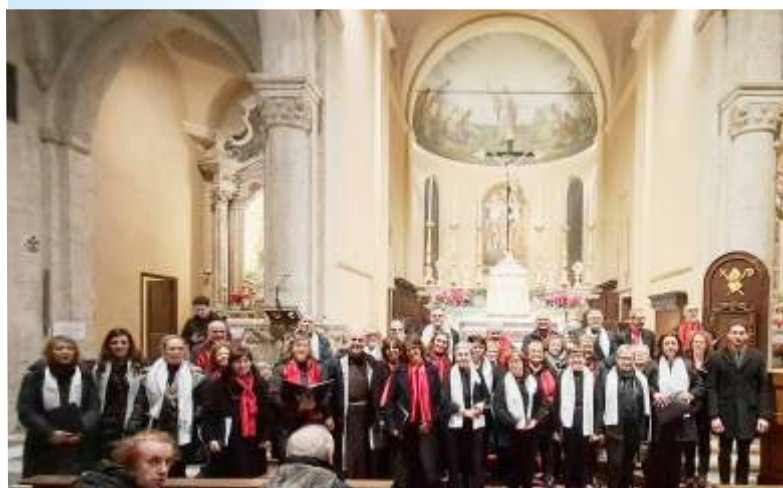
Sanremo, 05/01/2025, Concerto «Cori Riuniti»