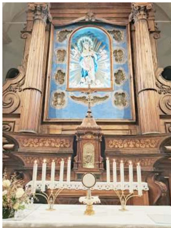
L'Adorazione Eucaristica del giovedì