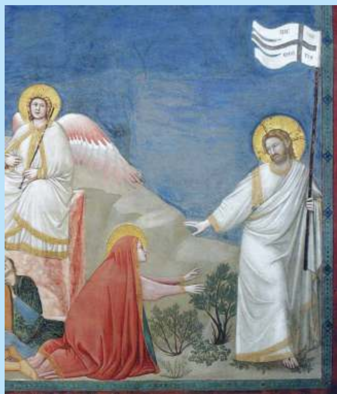
Padova. Cappella degli Scrovegni, Maddalena davanti a Cristo risorto, particolare

sia ancora, ma non c'è più. Quando noi sentiamo che lo Spirito Santo agisce nel nostro cuore e sentiamo che il Signore ci chiama per nome, sappiamo distinguere la voce del Maestro? Cari fratelli e sorelle, da Maria Maddalena, che la tradizione chiamò “apostola degli apostoli”, impariamo la speranza. Si entra nel mondo nuovo convertendosi più di una volta . Il nostro cammino è un costante invito a cambiare prospettiva. Il Risorto ci porta nel suo mondo, passo dopo passo, a condizione che non pretendiamo di sapere già tutto. Chiediamoci