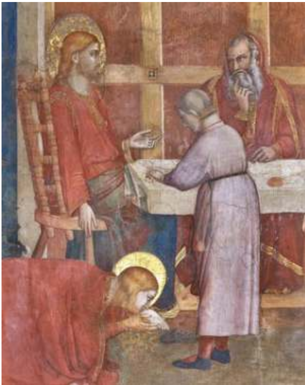
Assisi. Basilica inferiore di San Francesco, Cappella della Maddalena, particolare

oggi: io so voltarmi a guardare le cose diversamente, con uno sguardo diverso? Ho il desiderio di conversione? Un io troppo sicuro, troppo orgoglioso ci impedisce di riconoscere Gesù Risorto: anche oggi, infatti, il suo aspetto è quello di persone comuni che rimangono facilmente alle nostre spalle. Persino quando piangiamo e ci disperiamo, lo lasciamo alle spalle. Invece di guardare nel buio del passato, nel vuoto di un sepolcro, da Maria Maddalena impariamo a voltarci verso la vita. Lì il nostro Maestro ci attende. Lì il nostro nome è pronunciato. Perché nella vita reale c'è un posto per noi, sempre e dovunque. C'è un posto per te, per me, per ciascuno. Nessuno può prenderlo, perché è stato pensato da sempre per noi. È brutto, come si dice nel parlato volgare, è brutto lasciare la sedia vuota. Questo posto è per me, se io non ci vado... Ognuno può dire: io ho un posto, io sono una missione! Pensate questo: qual è il mio posto? Qual è la missione che il Signore mi dà? Che questo pensiero ci aiuti a prendere un atteggiamento coraggioso nella vita. Grazie.