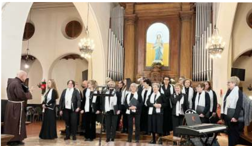
Loano, 15/12/2024, rassegna «Armonie Corali Liguri»

D omenica 15 dicembre, presso la chiesa dei frati Cappuccini di Loano, si è tenuta la terza edizione di "Armonie Corali Liguri. Natale in musica e solidarietà", manifestazione organizzata dall'Associazione Gruppi Corali Liguri. A questo importante evento ha partecipato la nostra Corale San Francesco insieme ad altri tre gruppi canori: il Coro Nova Tempora di Sanremo, Il Coro ConClaudia di Imperia e il Coro Loderò di Albenga. Nelle