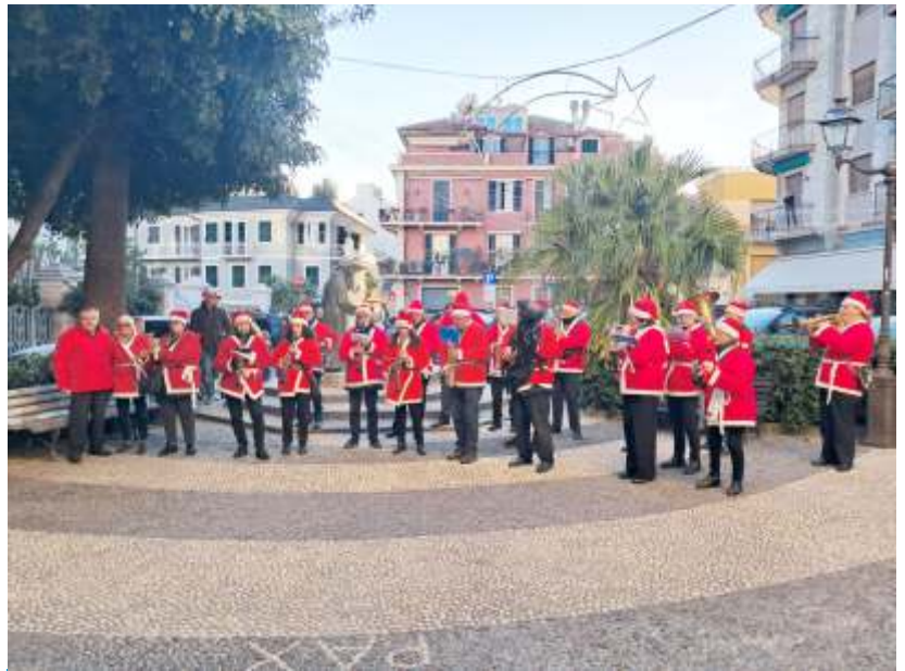
1° Gennaio 2025: come tutti gli anni, l'appuntamento è sul sagrato della nostra chiesa