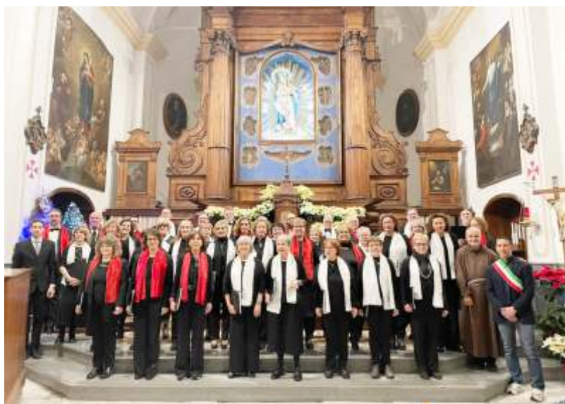
Alassio, 04/01/2025, Concerto «Cori Riuniti»