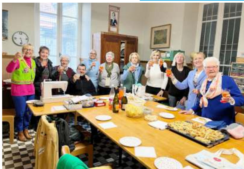
Si festeggia per le ultime idee realizzate: nelle foto a lato e sotto