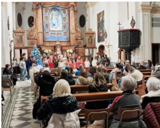
Nelle foto: il Concertino in preparazione al Natale di venerdì 20 dicembre