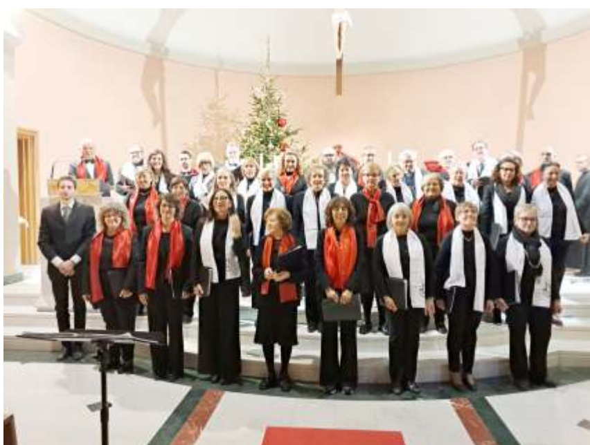
Imperia, 28/12/2024, Concerto «Cori Riuniti»

settimane seguenti, la Corale è stata impegnata in una serie di concerti, a cori riuniti, con il Coro Sacra Famiglia di Imperia. È stata una bella e positiva esperienza che ha confermato per l'ennesima volta che «l'unione fa la forza». Il 28 dicembre i due cori uniti hanno cantato a Imperia nella Parrocchia Sacra Famiglia; il 2 gennaio nella chiesa dei Cappuccini a Loano; il 4 gennaio nella nostra chiesa e il 5 gennaio a Sanremo, nella concattedrale di San Siro.