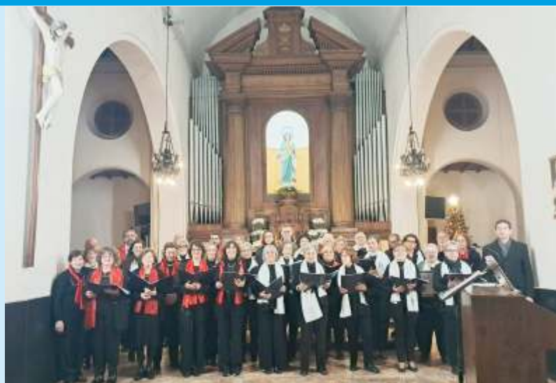
Loano, 02/01/2025, Concerto «Cori Riuniti»