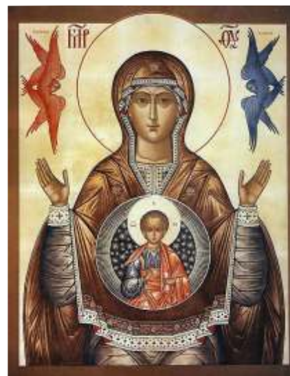
Maria, Speranza dell'umanità

parole. Lui ci conosce più di noi stessi, conosce le situazioni difficili che sfuggono al nostro controllo; a lui non sfugge nulla. Desidera solo che ci abbandoniamo a lui, nella gioia e nel dolore e che ci "fidiamo" perché lui non delude mai. Aggrappiamoci a lui, scrolliamoci di dosso tutte le nostre insicurezze, le nostre paure, le nostre angosce, togliamo la pietra dai nostri sepolcri e andiamo incontro con gioia al Risorto; è lui la nostra speranza; è solo lui che può rispondere alle nostre domande; è lui che ci dona, già fin da ora, la pace del cuore e la gioia della vita eterna! Unito ai miei confratelli, vi auguro una Santa Pasqua!