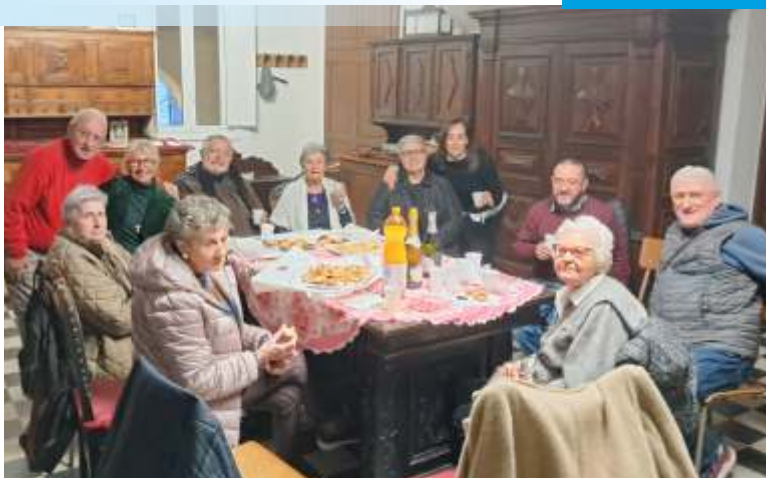
I terziari francescani, al termine del loro incontro di formazione, condividono anche un momento di gioiosa convivialità

L'Ordine Franciscano Secolare è un gruppo di cristiani che desidera conoscere il messaggio e la spiritualità di San Francesco d'Assisi per poi, con umiltà e gioia, cercare di viverli e metterli in pratica nel mondo di oggi.