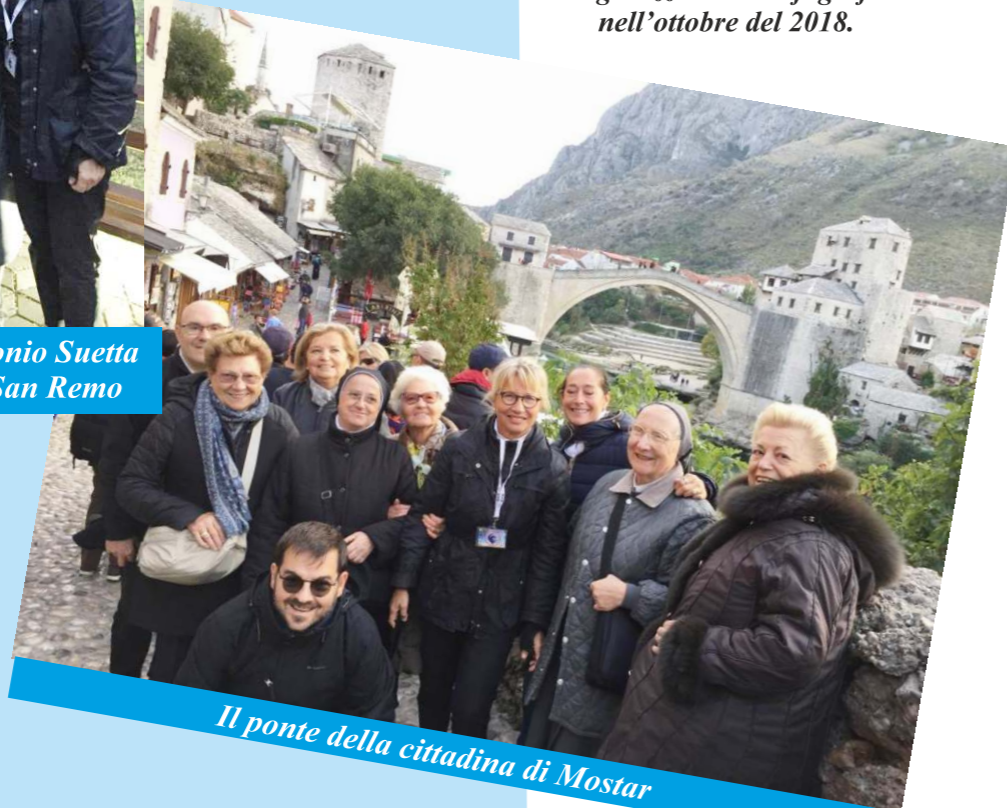
Il ponte della cittadina di Mostar