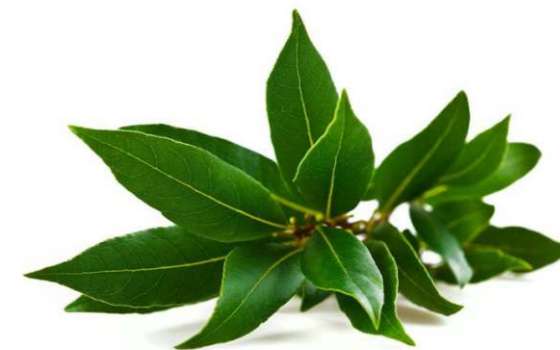
L'alloro, da tempo pianta della tradizione natalizia ligure