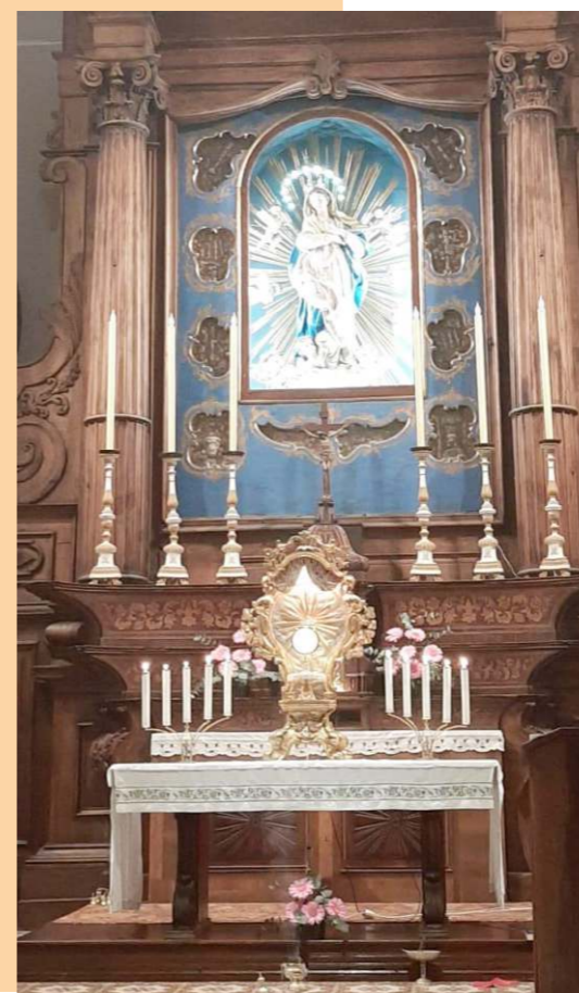
L'Adorazione eucaristica mensile del sabato sera

Carisma specifico del Rinnovamento nello Spirito è quello di approfondire la preghiera di intercessione allo Spirito Santo, impegnandosi inoltre a testimoniare il carisma cristiano nella vita quotidiana.