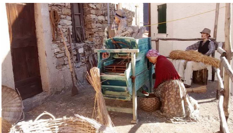
Pentema e il suo caratteristico presepe a grandezza naturale

tra i vicoli, le case antiche, i cortili e i personaggi, a grandezza naturale, che indossano costumi d'epoca e sono riprodotti durante l'esecuzione dei mestieri tipici della fine del XIX secolo.