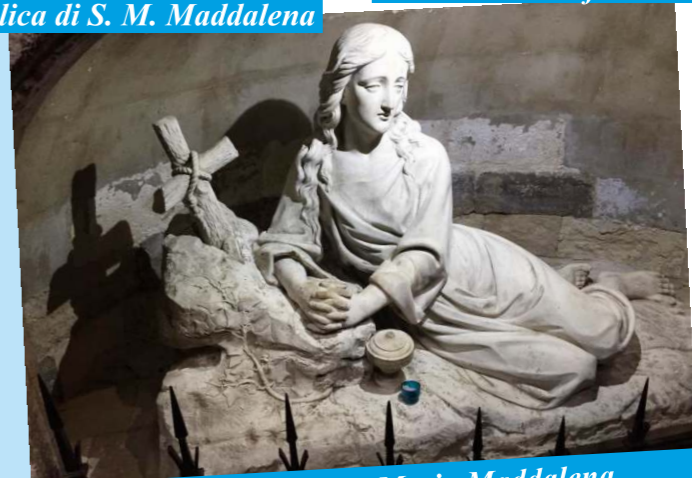
La tomba di Santa Maria Maddalena