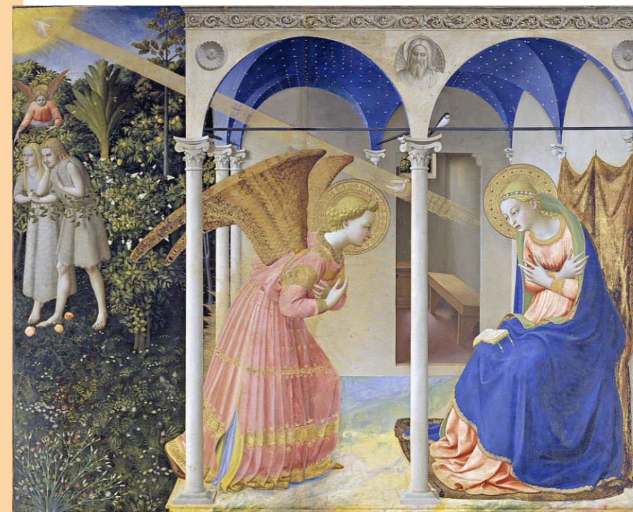
Beato Angelico, L'Annunciazione dell'Angelo a Maria (Museo del Prado - Madrid)

La quarta candela, di colore viola, è la Candela degli Angeli . Con essa onoriamo proprio gli angeli, i primi che annunciarono al mondo la nascita del Messia.