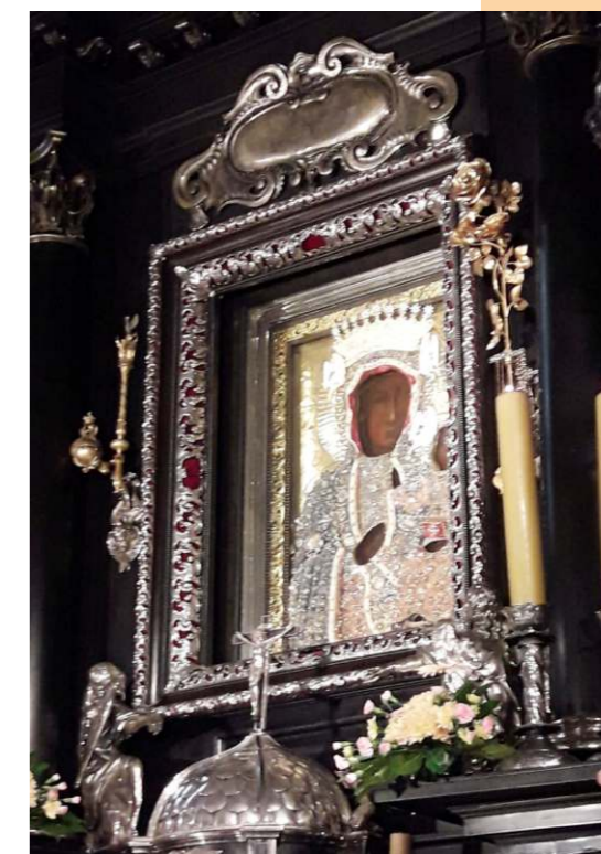
La Madonna nera di Częstochowa