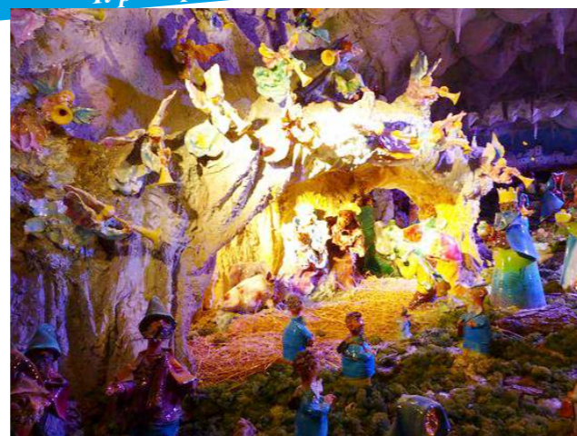
Il presepe in ceramica di Arenzano

tra i vicoli, le case antiche, i cortili e i personaggi, a grandezza naturale, che indossano costumi d'epoca e sono riprodotti durante l'esecuzione dei mestieri tipici della fine del XIX secolo.