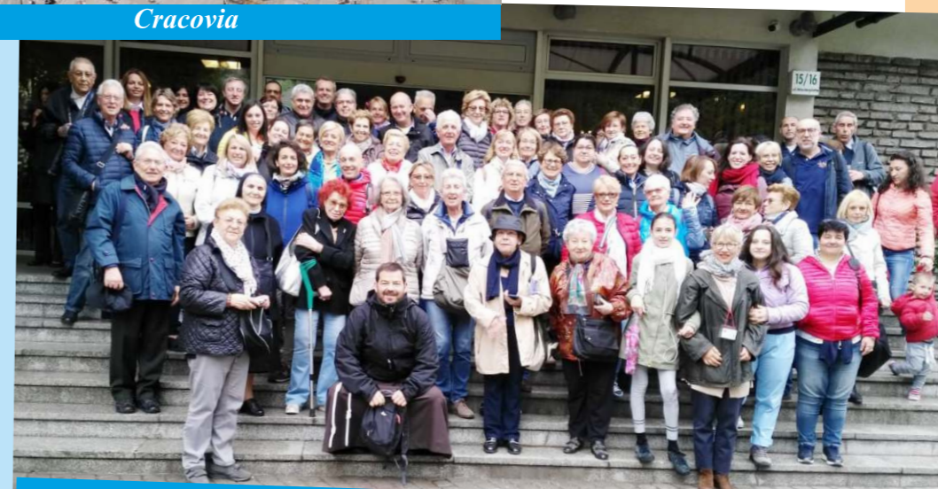
Il numeroso gruppo al completo