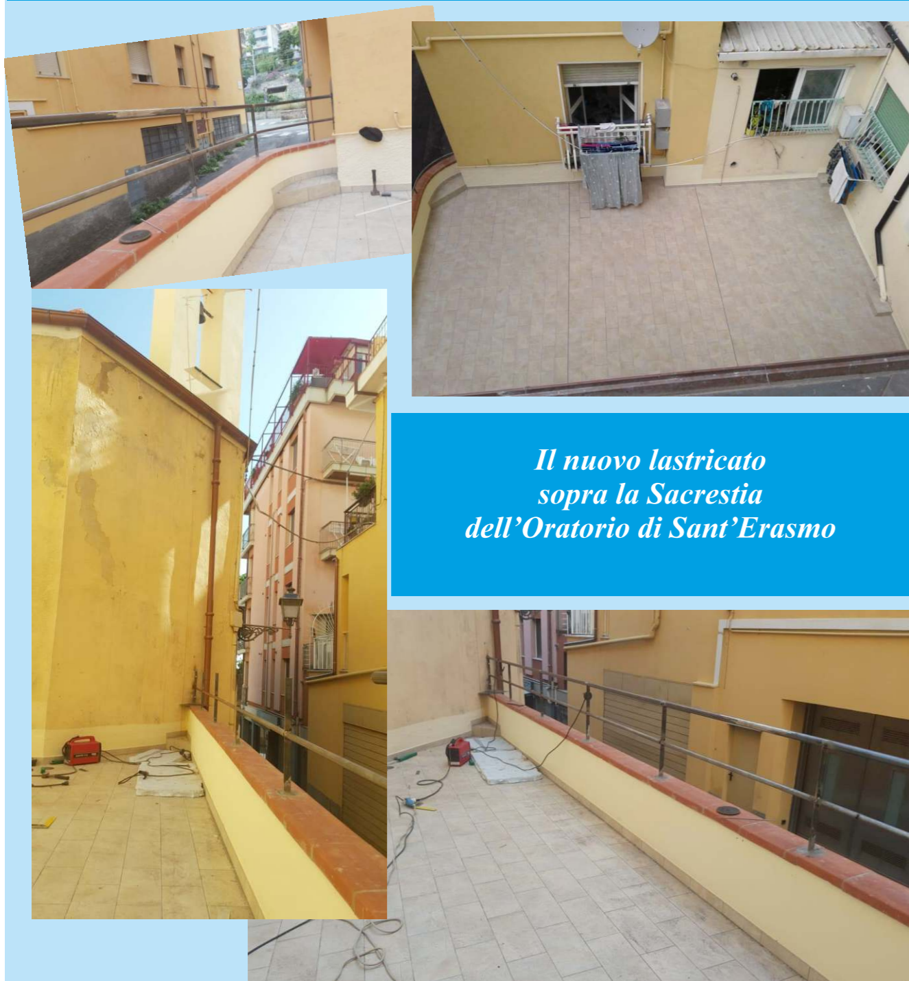
Il nuovo lastricato sopra la Sacrestia dell'Oratorio di Sant'Erasmus