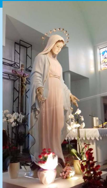
Alcune foto del pellegrinaggio che la Parrocchia ha organizzato a Medjugorje nell'ottobre del 2018.