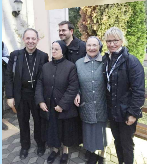
L'incontro con Mons. Antonio Suetta Vescovo di Ventimiglia - San Remo