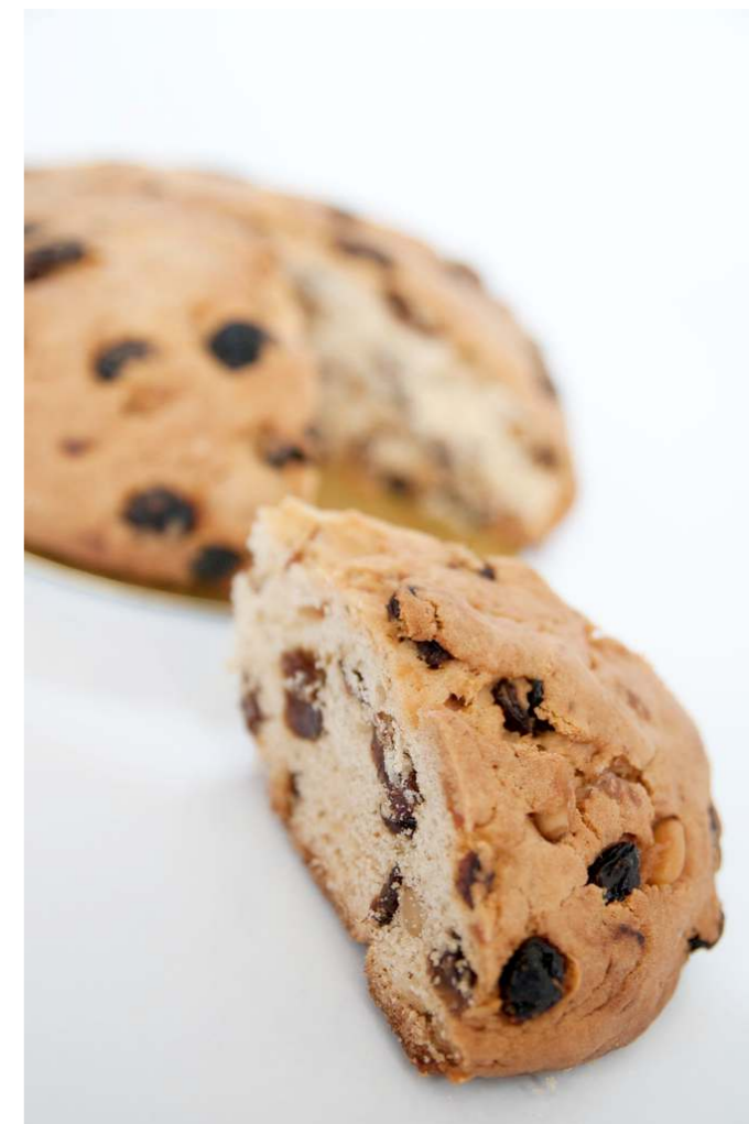
Il pandolce, immancabile sulle tavole liguri a Natale

Sulla tavola non dovevano mancare oggetti di buon augurio: uno scopino di erica benedetto durante la Messa di mezzanotte, una manciata di sale, un mestolo forato (cassoa) e due panini bianchi, uno per i poveri e l'altro per gli animali.