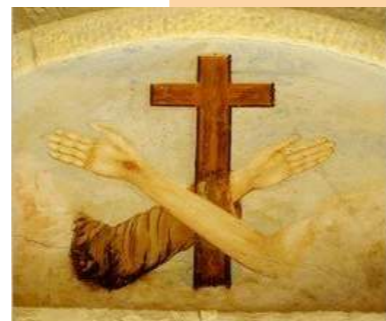
Lo Stemma Franciscano