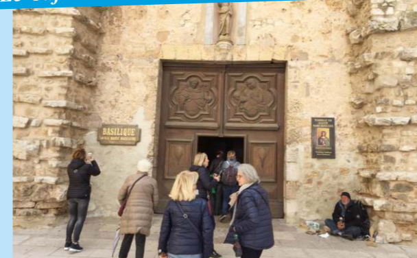
L'ingresso della Basilica di S. M. Maddalena