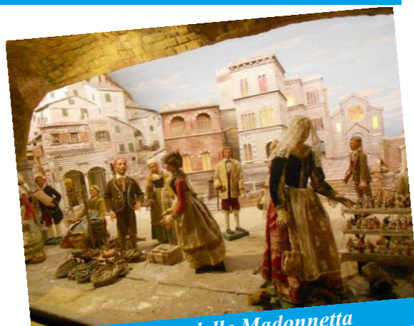
Il presepe delle Madonnetta

Sulle alture di Genova, a Pentema, una piccolissima frazione di Torriglia, non c'è un semplice presepe da guardare, ma un'atmosfera da vivere e in cui immergersi! La natività è